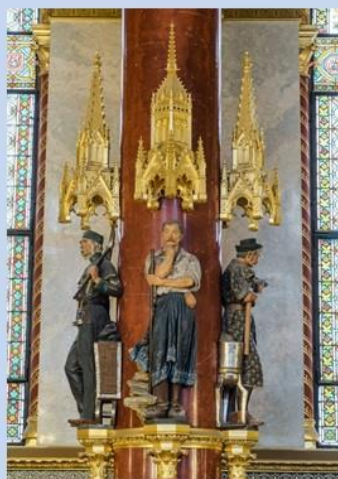
kőbányász szénbányász ércbányász