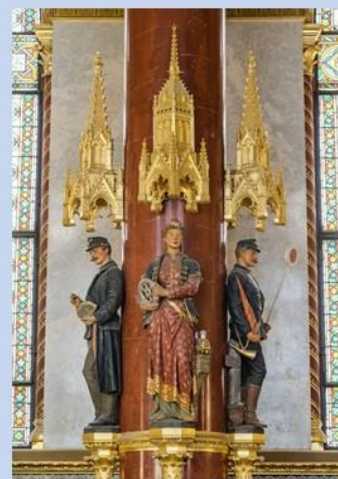
irányító kerékvizsgáló menetrend készítő